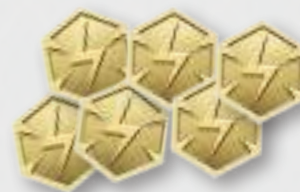
Crediti Idroelettrici 6 di valore 1