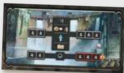
1 Plancia Azioni Aggiuntive