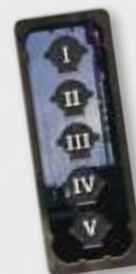
Tessera Ordine di Turno 5 Giocatori