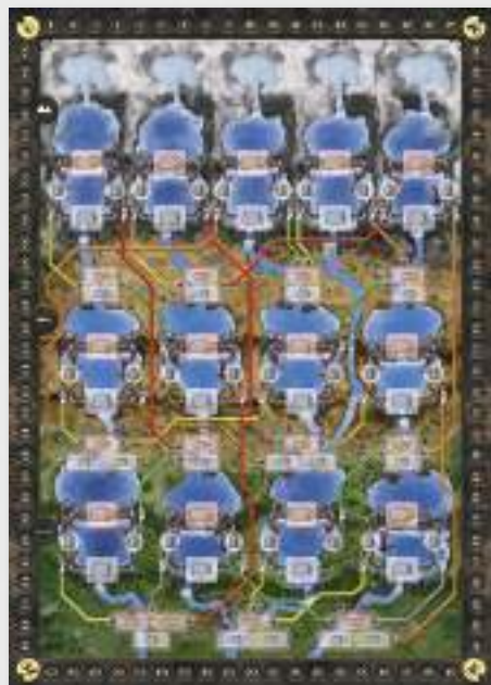
1 Nuova Mappa

Questa espansione è utilizzabile in partite a 4 e 5 giocatori. Per poter giocare in 5 è necessaria l'espansione The Leeghwater Project.