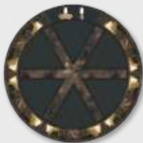
1 Ruota di Costruzione