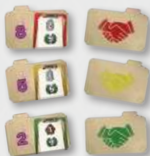
9 Tessere Contratto Privato